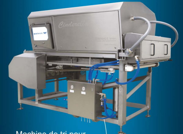
Machine de tri pour produits transformés