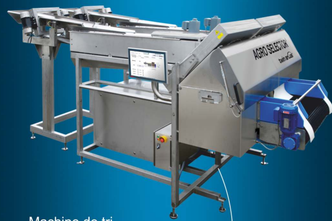
Machine de tri pour produits lavés non épluchés