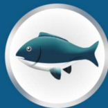
Fruits de mer