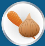
Pommes de terre & légumes

C'est pourquoi nous sommes la meilleure solution pour l'industrie alimentaire.