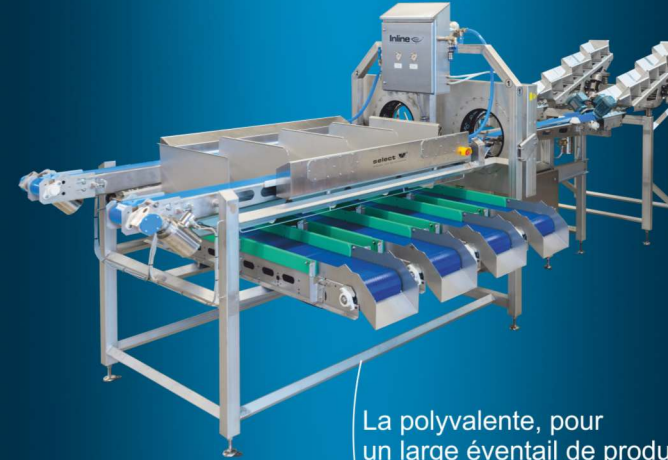
La polyvalente, pour un large éventail de produits