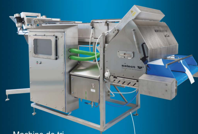
Machine de tri pour produits épluchés