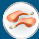
Viande & saucisses