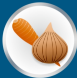
Pommes de terre & légumes

C'est pourquoi nous sommes la meilleure solution pour l'industrie alimentaire.