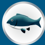
Fruits de mer